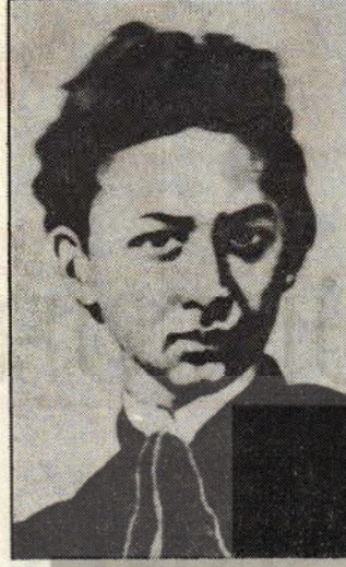
Nikolay Lobaçevskiy - Janos Bolyai

set çekilse de bir yolunu bulup akışını sürdürecektir.